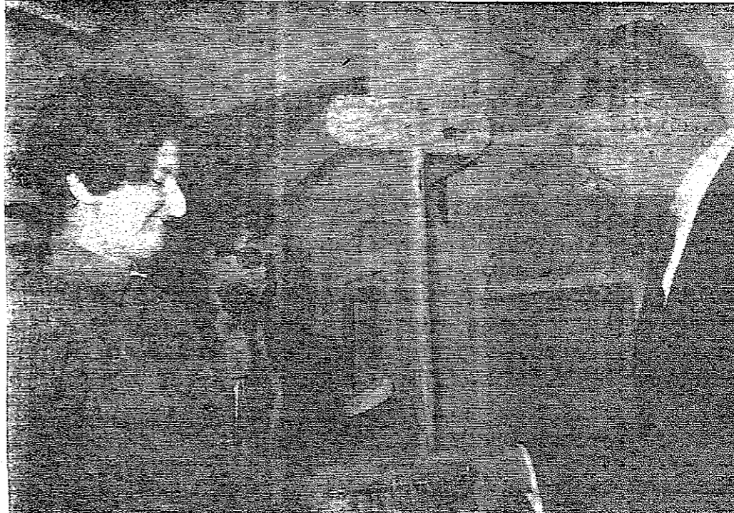
أقيم مساء أمس الأول معرض للموروث الفوتوغرافية في جمعية الشابات المسيحية اشترك فيه نخبة من هواة التصوير . وفي الصورة أحد الفائزين بتسلم جائزته .

عمان - تقصد لجنة السير المركزية الفرعية جلسة صباح اليوم في وزارة الداخلية للنظر في شؤون السير في محافظة العاصمة وخاصة في عمان ولايجاد الحلول المناسبة لترسيم السير وتقليل حركة المرور . والجدول بالذکر ان حركة السير تعطلت عدة ساعات صباح أمس في شارع الحطة ، بالإضافة إلى ازدحام السيارات وعرقلة حركة المرور في شارع وادي السير وطريق السلط . مراجعة قسم البعثات عمان - حاضا من وزارة التربية والتعليم ما يلي : يرجى من الانسبة اناسم عدي مراجعة قسم البعثات في وزارة التربية والتعليم في الساعة العاشرة من صباح اليوم ( الاحد ) لامر يتعلق ببعثتها .